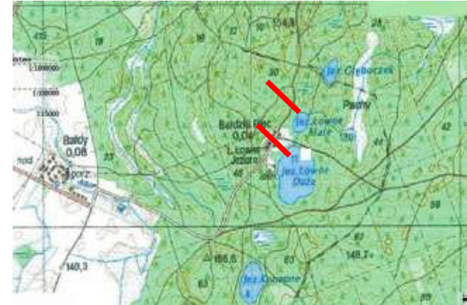
Jezioro Jagocin Duży (16 ha), Mały (19 ha) gmina Purda