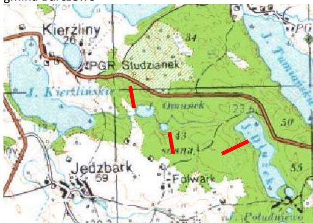
Jeziro Omtunek (16 ha) Masakojtek (3ha) Dłużek (48ha) gmina Barczewo