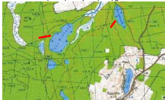
Jezioro Mielnik (18 ha) Bobrynek (8 ha) gmina Gietrzwałd