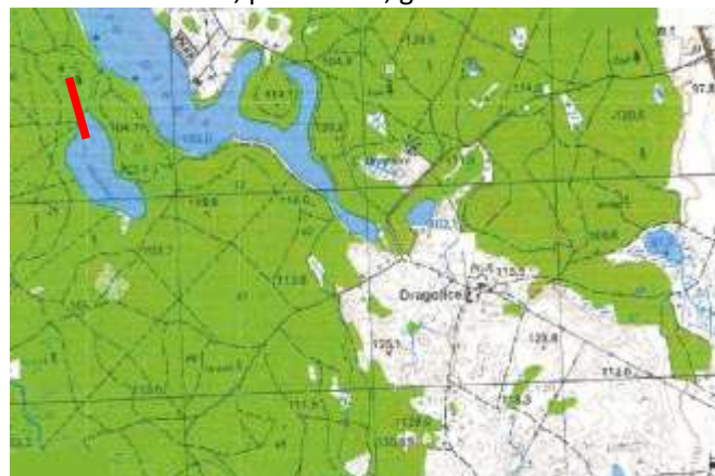
Jezioro Harcerskie, pow. 14 ha, gmina Łukta