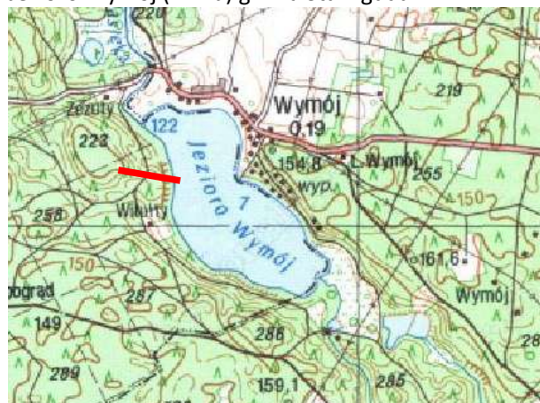
Jezioro Wymój (47 ha) gmina Stawiguda