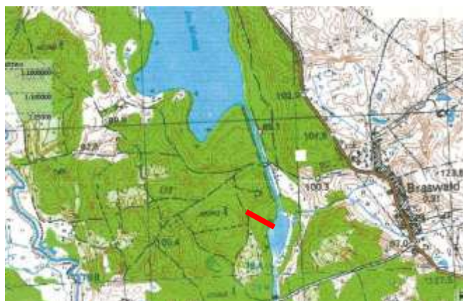
Jeziro Skłodzin (3,5 ha) gmina Dywity