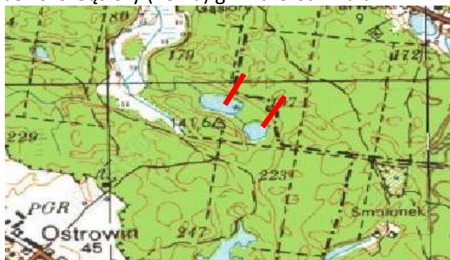
Jeziro Gąsior (18 ha) gmina Gietrzwałd